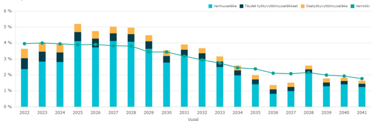
Taulukko 13. Eläköitymisennuste 2022 - 2041 (Lähde Kelan verkkosivut)